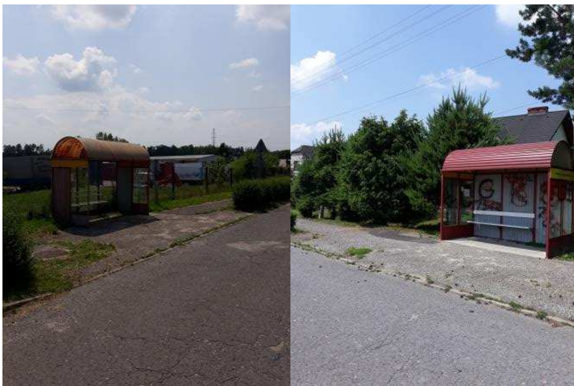
Istniejące perony autobusowe