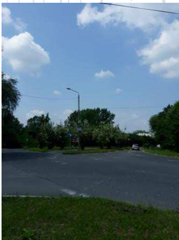
Skrzyżowanie ulicy Morcinka z drogą do byłej KWK Morcinek