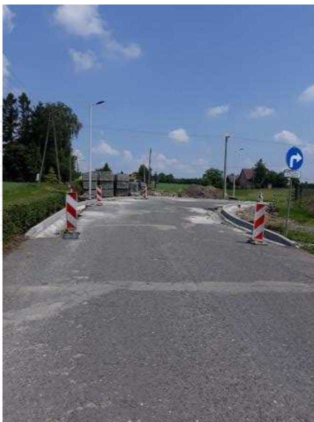
Koniec opracowania – Skrzyżowanie ul. Morcinka z ul. Stlamacha

Istniejącą konstrukcję drogi można wykorzystać do dalszej eksploatacji przy wymianie i wzmocnieniu warstw bitumicznych.